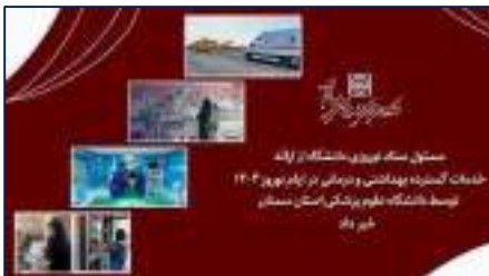
ارائه خدمات گسترده بهداشتی و درمانی در ایام نوروز ۱۴۰۴ توسط دانشگاه علوم پزشکی استان سمنان ۱۴۰۴/۰۱/۰۹