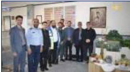
بازدید نروزی استاندار سمنان از بیمارستان معتمدی و اورژانس پیش بیمارستانی شهرستان گرمسار ۱۴۰۴/۰۱/۰۲