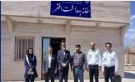
بازدید نوروزی دکتر قدس رئیس دانشگاه از حوزه سلامت شهرستان سرخه ۱۴۰۴/۰۱/۱۰