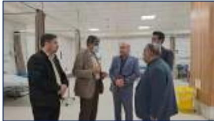
بازدید سرزده جمعی از مسئولان استانی از مرکز آموزشی، پژوهشی و درمانی کوثرسمنان ۱۴۰۴/۰۱/۰۵