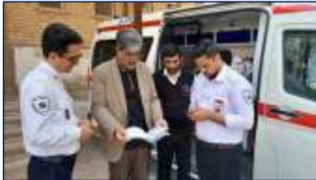
بازدید رئیس دانشگاه علوم پزشکی استان سمنان از پایگاه‌های اورژانس پیش بیمارستانی شهرستان سمنان ۱۴۰۴/۰۱/۰۳