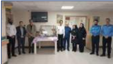
ارزیابی نحوه ارائه خدمات بهداشتی و درمانی شهرستان مهدیشهر توسط رئیس دانشگاه علوم پزشکی استان سمنان در نوروز ۱۴۰۴ ۱۴۰۴/۰۲/۰۴