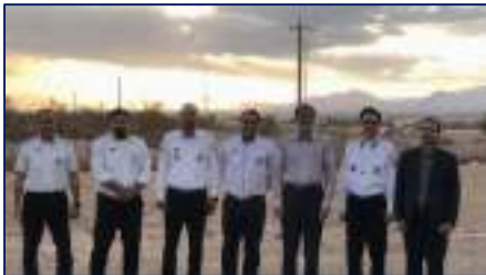
بازدید رئیس دانشگاه علوم پزشکی استان سمنان از حوزه اورژانس پیش بیمارستانی جنوب و شمال شهرستان دامغان ۱۴۰۴/۰۱/۱۰