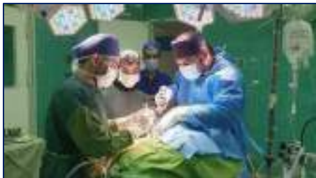
نجات جان زائر جوان امام رضا(ع) پس از تصادف در جاده‌های سمنان با عمل جراحی همزمان ۱۴۰۴/۰۱/۰۴