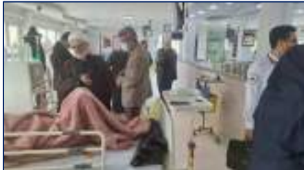
بازدید نروزی بازرس کل استان سمنان از بیمارستان کوثر سمنان ۱۴۰۴/۰۱/۰۲