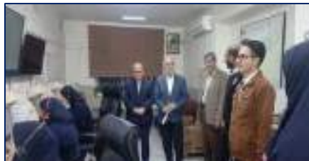
بازدید سرزده رئیس سازمان اورژانس کشور و مسئول اجرای طرح سلامت نوروزی وزارت بهداشت از خدمت رسانی دانشگاه علوم پزشکی استان سمنان در نوروز ۱۴۰۴ ۱۴۰۴/۰۱/۰۶