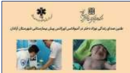
شروع برای زندگی هرگز منتظر نمی ماند، نخستین تولد در آمبولانس های دانشگاه علوم پزشکی استان سمنان ۱۴۰۴/۱۰/۰۹