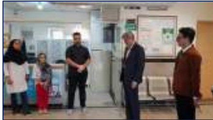
دیدار عیدانه دکتر قدس رئیس دانشگاه با کارکنان حوزه سلامت شهرستان های سرخه و آرادان ۱۴۰۴/۰۱/۰۶