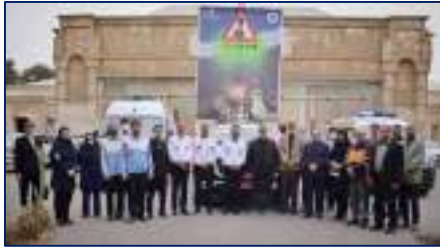
بازدید نروزی استاندار سمنان از حوزه بهداشت و مدیریت اورژانس پیش بیمارستانی ۱۱۵ دانشگاه ۱۴۰۴/۰۱/۰۱