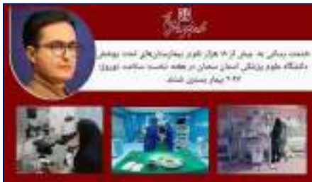
خدمت رسانی به بیش از ۱۸ هزار نفر در بیمارستان‌های تحت پوشش دانشگاه در هفته نخست سلامت نوروز ۱۴۰۴ ۱۴۰۴/۰۱/۰۲