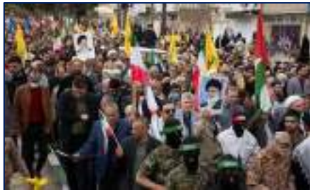
طنین فریاد مرگ بر اسرائیل توسط خانواده بزرگ دانشگاه علوم پزشکی استان سمنان در راهپیمایی روز جهانی قدس ۱۴۰۴/۰۱/۰۸