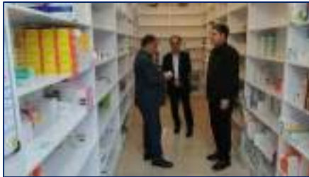
سنجش کیفیت ارائه خدمات دارویی به هم وطنان عزیز توسط سرپرست معاونت غذا و دارو دانشگاه ۱۴۰۴/۰۱/۰۶